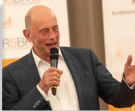
沃尔夫冈·蒂芬泽 图林根州经济、科学和数字化社 会部部长