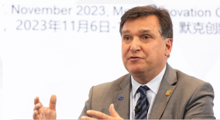
斯蒂芬·诺瓦齐 联邦职业培训教师协会BvLB联邦副 主席，(于尔岑第一职业学校 (BBS Uelzen) 校长及教育网络“职业教 育可持续发展BBNE”总负责人)