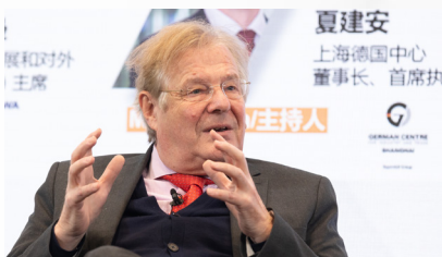
霍斯特·洛切尔教授