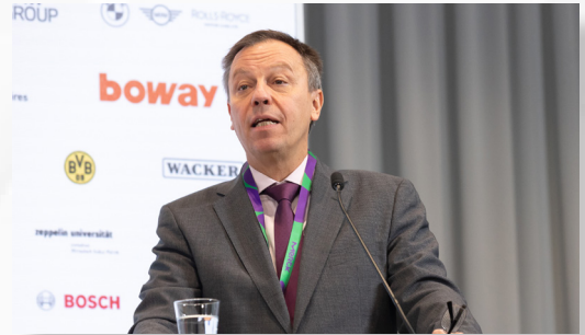
克劳斯·穆尔哈恩教授 (余凯思)