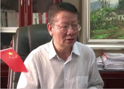
陈世波教授 云南省委教育工委副书记