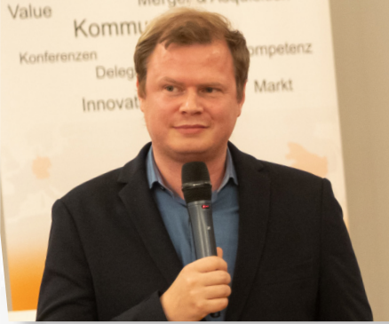
米歇尔·萨洛莫 德国海登海姆市市长