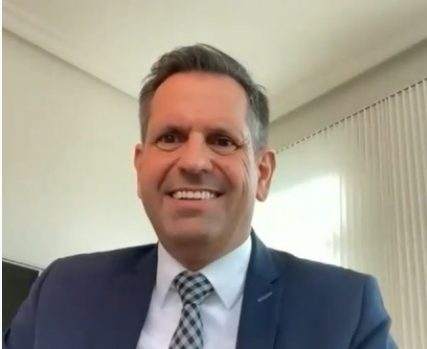
Olaf Lies, MdL

Minister Niedersächsisches Ministerium für Wirtschaft, Verkehr, Bauen und Digitalisierung