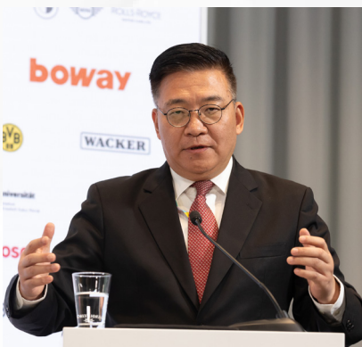
GUO Yezhou Vizeminister der Internationalen Abteilung beim Zentralkomitee der KPCh Vorsitzender des Rates der Silk Road Think Tank Asso- ciation (SRTA)